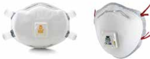
Şekil : Genelde kullanılan farklı tip filtreli maskeler