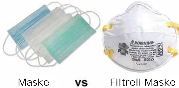
Şekil : Maske ile filtreli maske

N95 veya FFP2 veya daha üstünü; ağıza çökmeyen tasarım ile daha iyi nefes alabilirlik sağlar (örn. ördek gagası veya kupa şekilli)