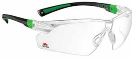
Daha az koruma

Cilt ile iyi sızdırmazlık sağlamalı. Tüm yüz hatlarına kolayca sığmalı. Esnek PVC çerçeve eşit basınç sağlamalı. Gözleri çevreleyen ve çizilmeye dayanıklı şeffaf plastik yapıda olmalı. Ayarlanabilir bant, klinik aktivite sırasında gevşek olmayacak şekilde sıkıca sabitlemek için bulunmalı. Dolaylı havalandırma ile buğulanmayı önlemeli, tekrar kullanılabilir olabilir (kontaminasyon olmaması için uygun şartlar mevcutsa) veya tek kullanımlık