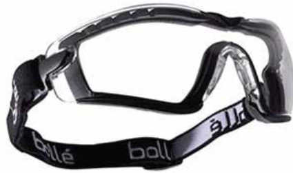
Daha fazla koruma